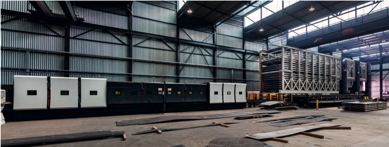
LS DISK laser station with STOCKTEC Storage System Estación láser LS DISK con Sistema de Almacenamiento STOCKTEC